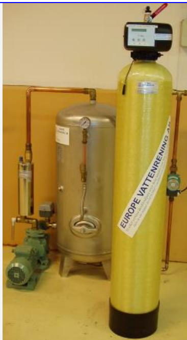
Europe Filtersystem för hydrofor

Vill du veta mer? I så fall är vårt Tel 0478-10017